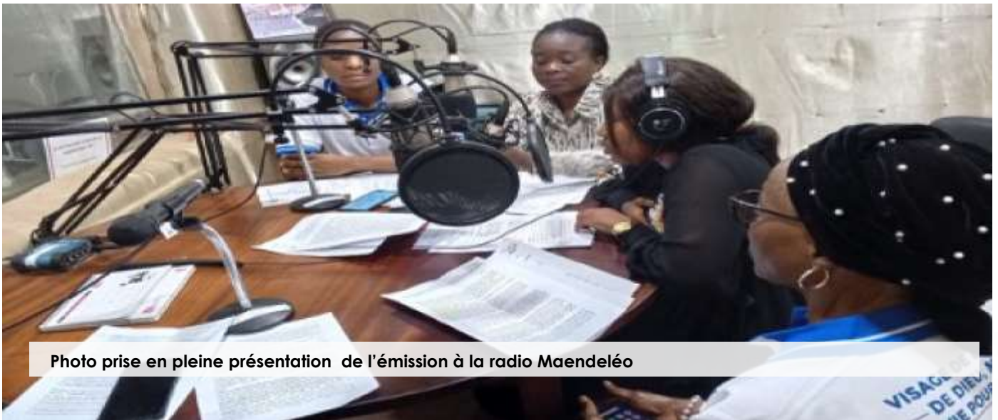
Photo prise en pleine présentation de l'émission à la radio Maendéléo

Dans le cadre du règlement pacifique des conflits, AFEJUCO a organisé de séances d'écoutes, d'orientation et des médiations dans ses zones d'interventions aux profits des femmes, filles et enfants victimes des violences basées sur le genre ; 120 cas des SGBV sont enregistré dans la ville de Bukavu