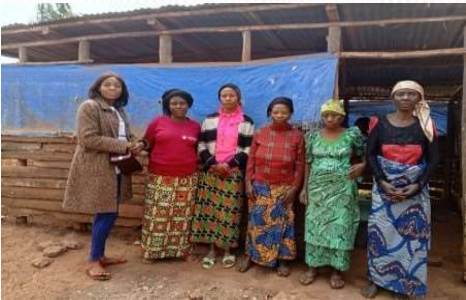
Photo prise lors de la descente de suivi de proximité (Suivi de cas de SGBV) à Mumosho