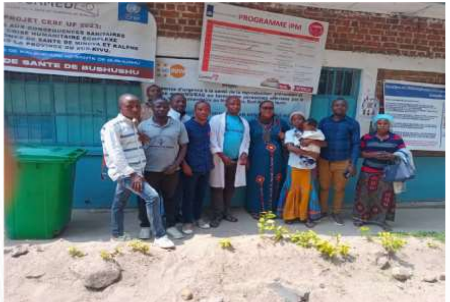
Lors de suivi des activités à BUSHUSHU, dans la zone de santé de KALEHE