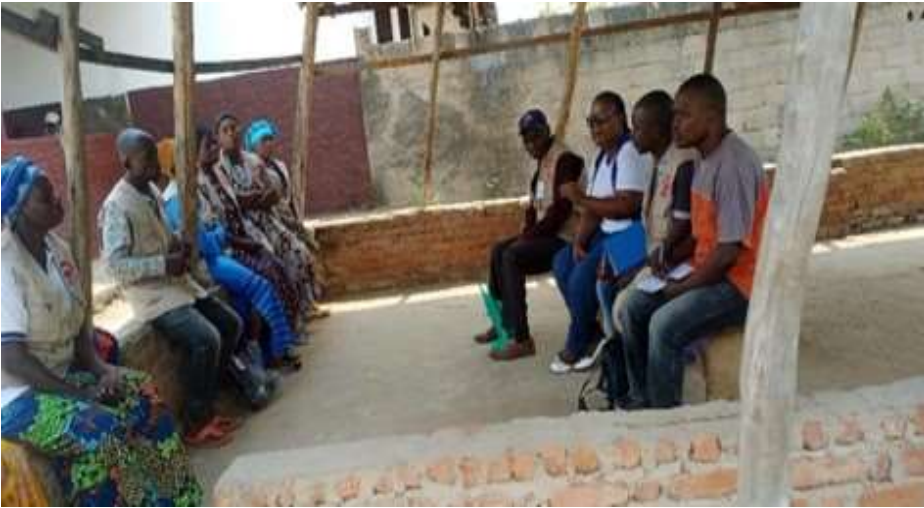
En pleins échanges lors de suivi des activités À NAZARENO, dans la Zone de santé de RUZIZI