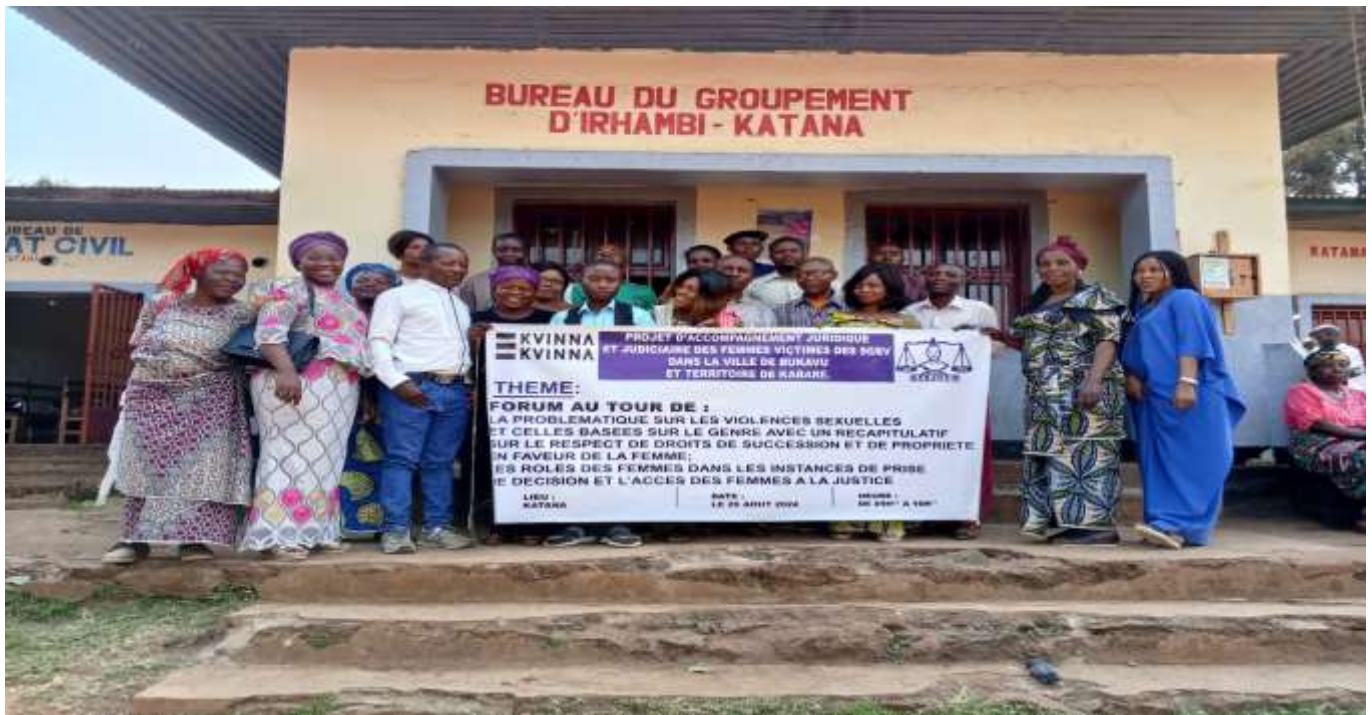
Pour une sensibilisation contre les Violences faites aux femmes, photo prise à NAZARENO/AFEJUCO dans la plaine de la RUZIZI.