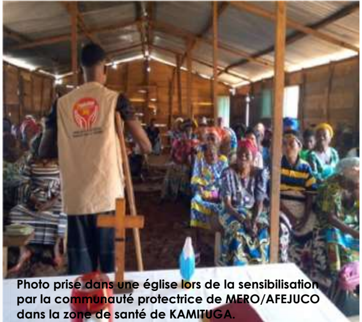
Photo prise dans une église lors de la sensibilisation par la communauté protectrice de MERO/AFEJUCO dans la zone de santé de KAMITUGA.

Dans l'objectif d'atteindre un plus grand nombre et aboutir progressivement au changement de mentalités, AFEJUCO produit et diffuse des émissions radios, chaque Mardi de 16h à 16h 30 et chaque Jeudi de 13H30 à 14h à la Radio Maendeleo. Lors de ces émissions radio, plusieurs sujets sont abordés à savoir :